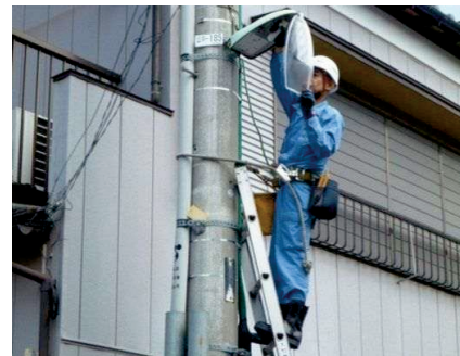
交通安全施設維持管理事業

また、区役所職員による青色防犯パトロールや中央区防犯協議会との連携による防犯啓発活動などにより、区民の防犯意識の向上を図り、安全・安心なまちづくりを推進します。