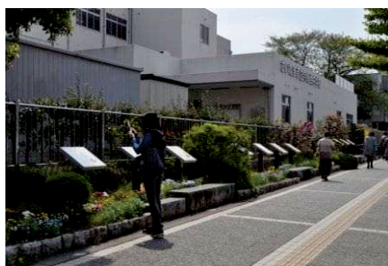
アートストリート事業（手形レリーフ）

中央区には、蔵造り住宅などの文化的資源のほか、さいたま新都心や彩の国さいたま芸術劇場といった魅力ある地域資源が存在しています。中央区では、JR与野本町駅から彩の国さいたま芸術劇場までの道を「アートストリートエリア」として整備し、区の花「バラ」と彩の国さいたま芸術劇場をデザイン化したバナーの設置や劇場出演者の手形レリーフの設置を行うなど、これらの地域資源を活かしながら、文化・芸術が息づくまちづくりを進めています。