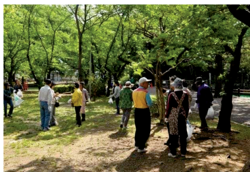
コミュニティ協議会（与野公園清掃）

また、コミュニティ協議会の加入団体への事業支援や区のまちづくりに寄与している団体に対する支援など、地域に住む人たちや様々な団体との協働によるまちづくりを進めています。