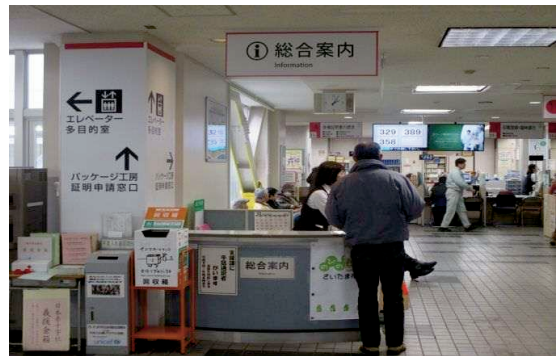
区役所総合案内事業

区役所への来庁者に対して、内容を的確に把握し、分かりやすい説明と各種届出の手續等の案内を行います。