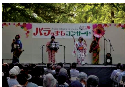
バラのまち中央区アートフェスタ事業